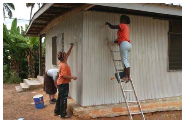
Des jeunes gabonais s'attaquant à la peinture