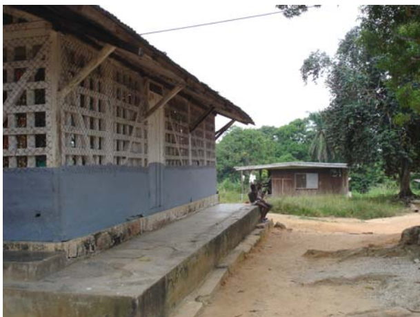
Création d'une maison d'accueil pour les orphelins du SIDA

Chargée de développement et de la communication à la Fondation Internationale de l'Hôpital du Dr. Schweitzer à Lambaréné (Tél. 03 88 32 71 44 ou par email à : fondation.schweitzer@laposte.net )