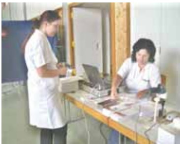
1. L'accueil est assuré par la section