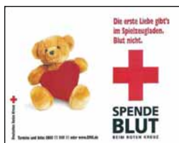
8. Exemple d'autocollant : www.DRK.de