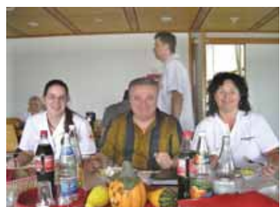
9. UN GRAND MERCI A MES HOTES !