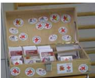
7. Matériel de promotion à disposition