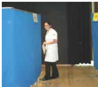
2. Passage chez le médecin