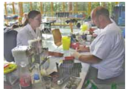
3. Contrôle du taux d'hémoglobine