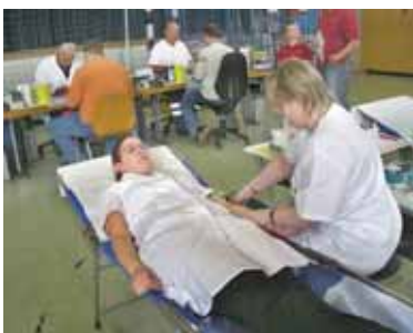
4. Le moment le plus important