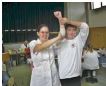
5. Accompagnement par un bénévole