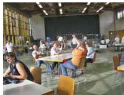
6. Quelques minutes de repos mérité